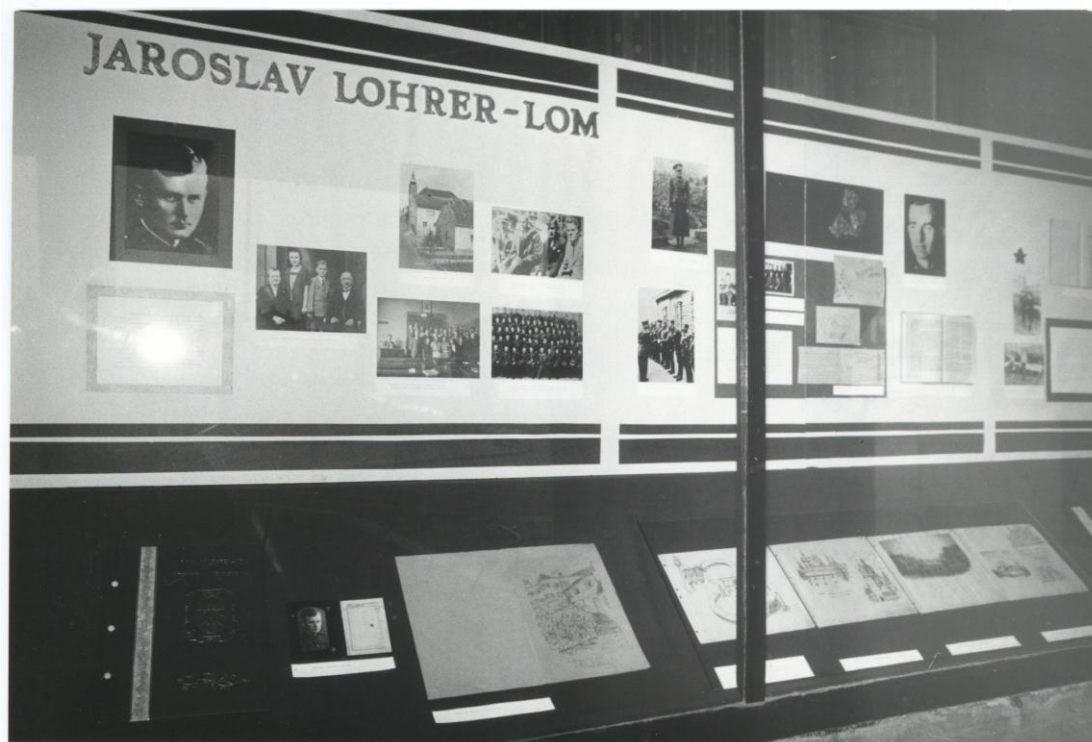
Fotografie dokazuje, jak to ve výkladu spořitelny v r. 1963 vypadalo.

v kronice je uvedeno pod heslem Přejmenování uli, že k 29. 12. 1964 byly některé ulice přejmenovány, jiné nové vznikly. Ulice Npor. Loma nahradila Farní uličku. Dnes ale víme, že ulice Npor. Loma je jedna z ulic na „starém“ sídlišti. Ulici Npor. Loma najdeme také ve Frýdku-Místku i v Sokolovu.